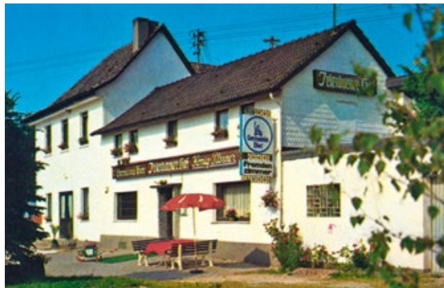
Gasthof Irlenborner Hof