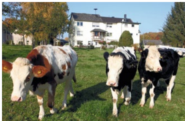
Ferienwohnung „Am Natursteig Sieg“

Preis inklusive Wäschepaket und Endreinigung