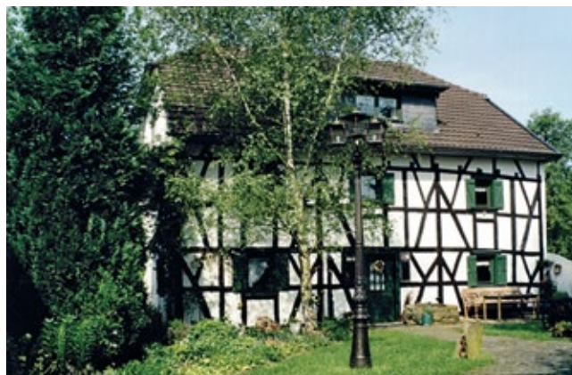
Historisches Haus Unkelbach ***

Aufschlag bei Buchung einer Einzelnacht Preise inklusive Wäschepaket und Endreinigung