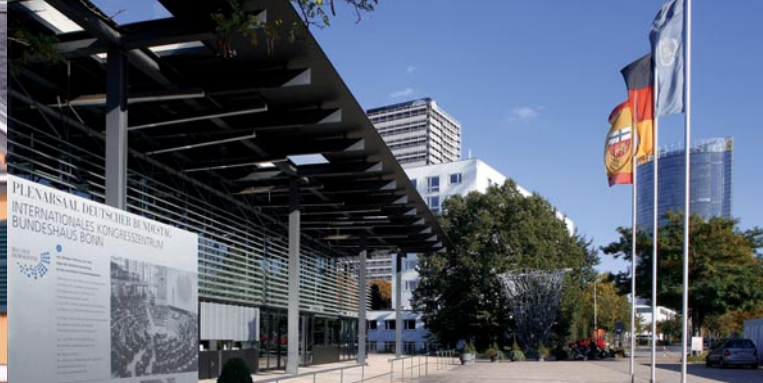
Plenarsaal mit UN Campus