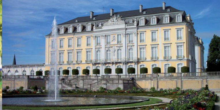
Schloss Augustusburg, UNESCO Kultur- und Naturerbe der Welt