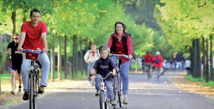
Radtour in Bonn