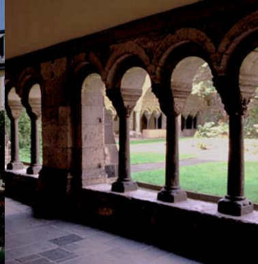
Kreuzgang der Münsterbasilika