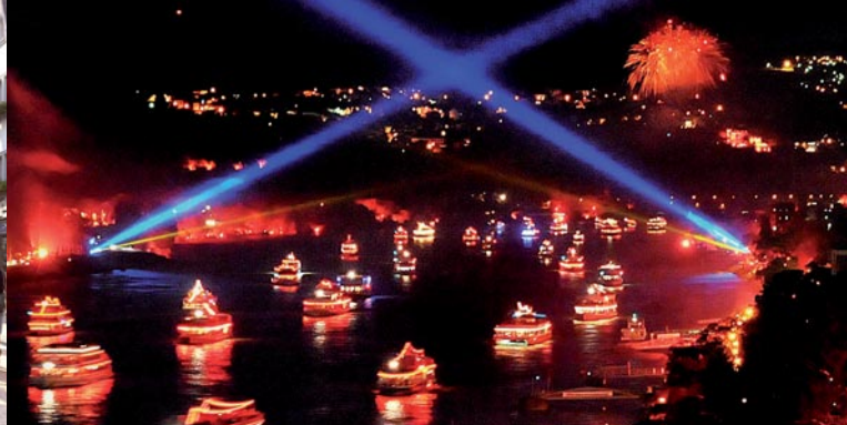
Rhein in Flammen