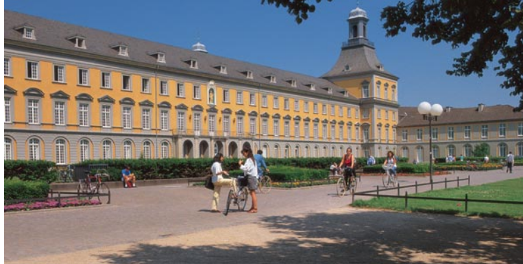
Rheinische Friedrich-Wilhelms-Universität Bonn