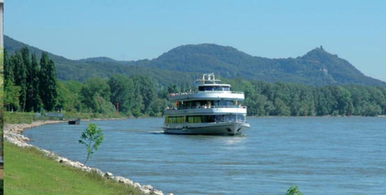
Schiffahrt auf dem Rhein