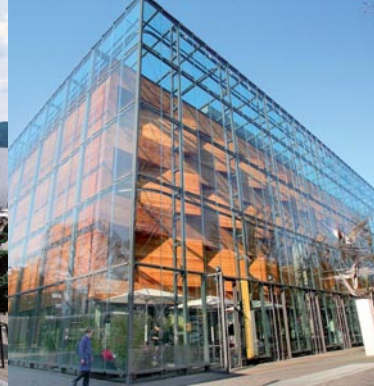
LVR – Landesmuseum Bonn