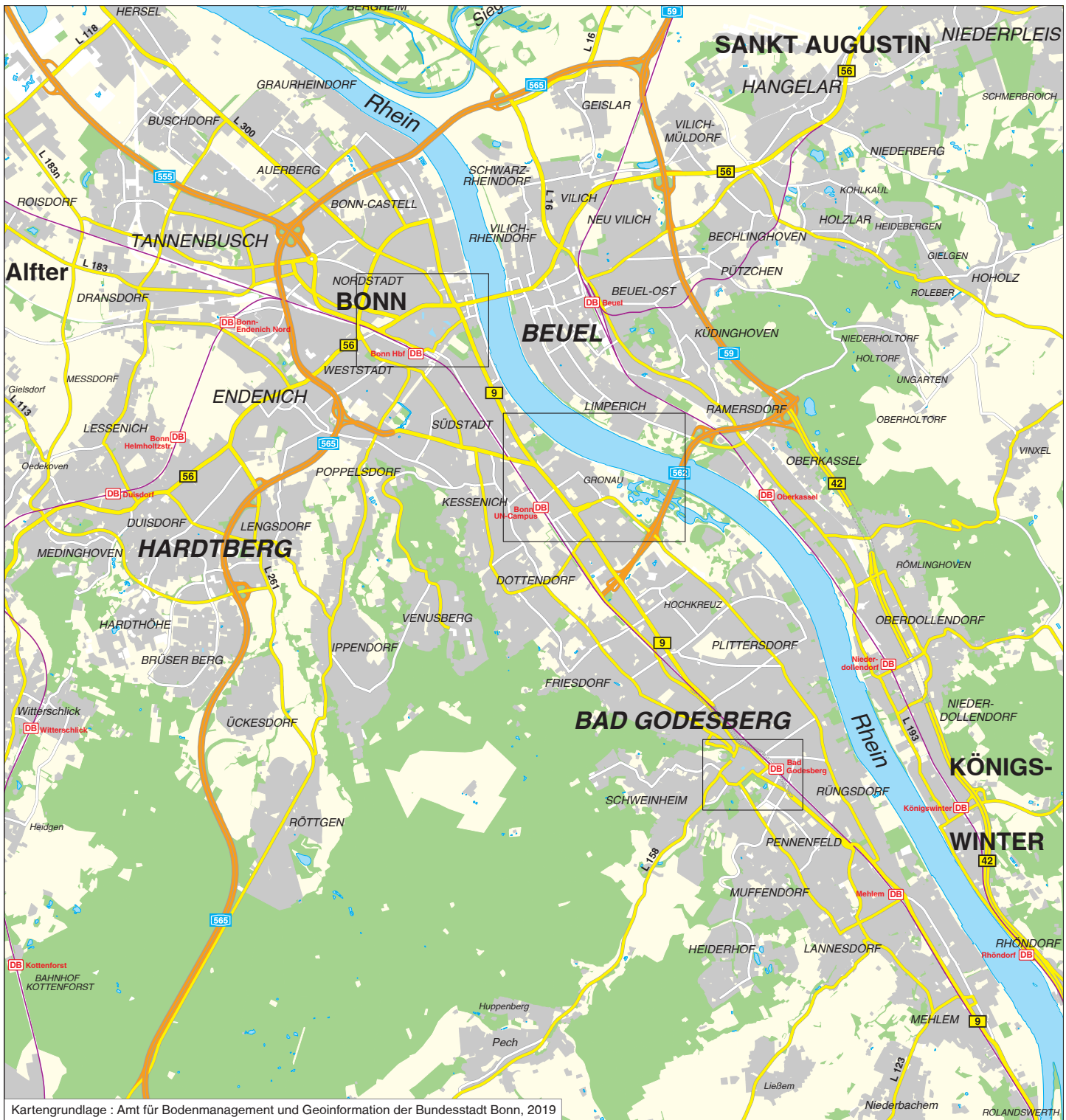
Kartengrundlage : Amt für Bodenmanagement und Geoinformation der Bundesstadt Bonn, 2019