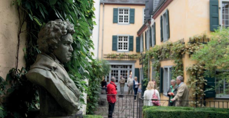
Garten des Beethovenhauses