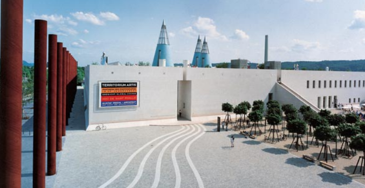
Kunst- und Ausstellungshalle / Bundeskunsthalle