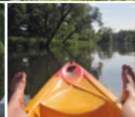
Kanufahren auf der Sieg