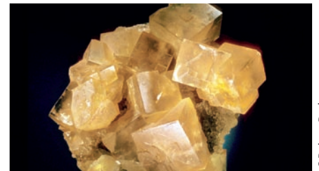
Die Schönheit eines Fluorits