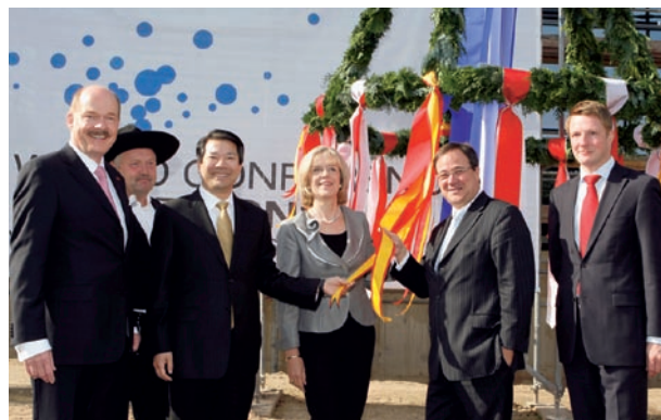
Richtfest beim WorldCCBonn

„Bonn ist ein hervorragender UNO-Standort und ein toller Gastgeber. Die Konferenzteilnehmer fühlen sich hier wohl und das macht für die Verhandlungen viel aus“, sagte Merkel.