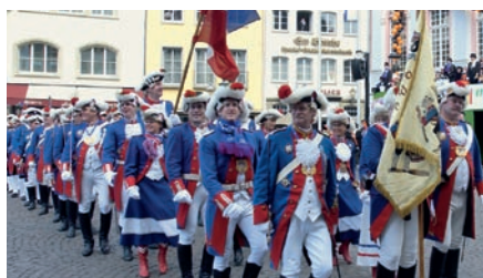
Die Bonner Stadtsoldaten