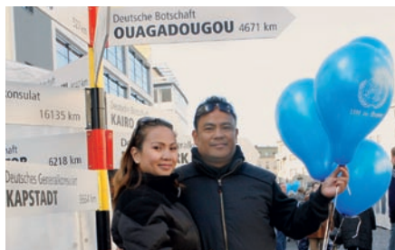
UN-Tag auf dem Marktplatz