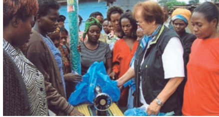
Ausbildungshilfe für Näherinnen

Ob Schweizer-Ausbildung in Algerien, Pastaproduktion in Äthiopien, Hilfe für Näherinnen in Kambodscha oder Qualitätsverbesserungen an Druckmaschinen in Ecuador – die ehrenamtlichen Mitarbeiter des „Senior Experten Service“ verstehen sich als Botschafter Deutsch-