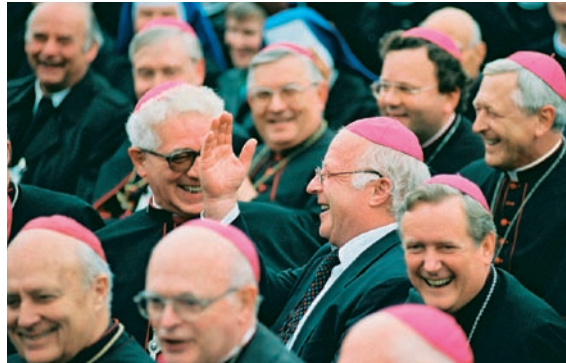
Bundesarbeitsminister Norbert Blüm beim Papstbesuch in Berlin 1996

Ob Konrad Adenauer in der Nachkriegszeit oder Gerhard Schröder zum Jahrtausendwechsel: Im Kampf um politische Macht versuchen die Kandidaten der Volksparteien mit Wahlkampfplakaten, Bildern von Parteitag und Fotos aus ihrem Privatleben Emotionen bei den Wählern zu wecken. Auf diese Weise entstehen manchmal Momentaufnahmen, die ungewollt auch zu Karikaturen werden können, wenn das aktuelle politische und mediale Umfeld in Vergessenheit geraten ist - so bei Klaus Töpfer als Umweltminister, der in den Rhein springt, um dessen gute Wasserqualität zu belegen oder Norbert Blüm, der sich mit geliehem Käppchen unter die versammelten Bischöfe begibt. 60 Beispiele von Wahlkampfplakaten von 1945 bis heute zeigt das Haus