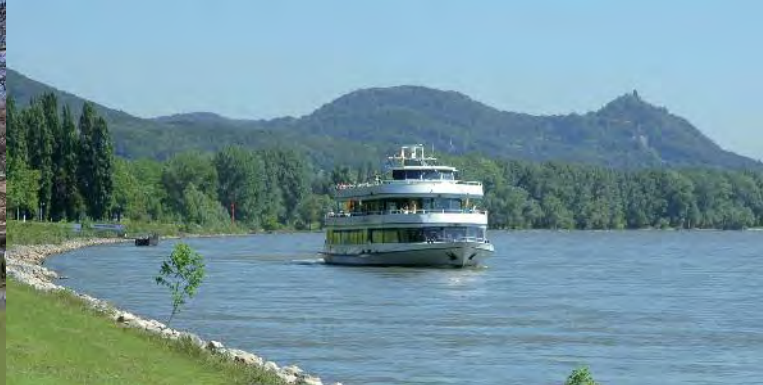
Schiffahrt auf dem Rhein