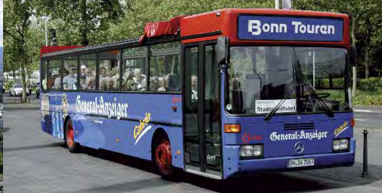
BonnTouren mit dem Cabriobus