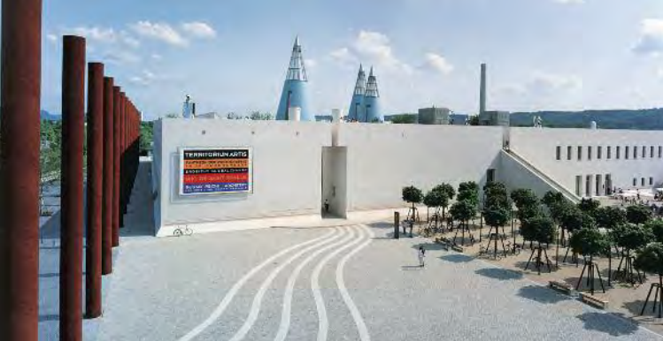
Kunst- und Ausstellungshalle