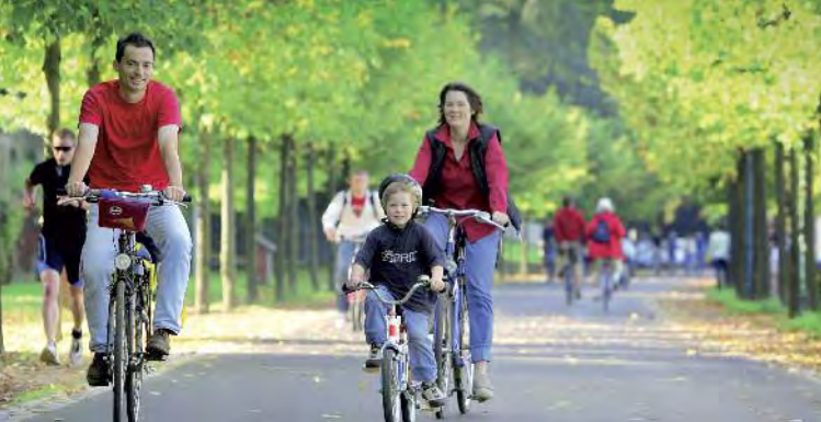
Radtour in Bonn