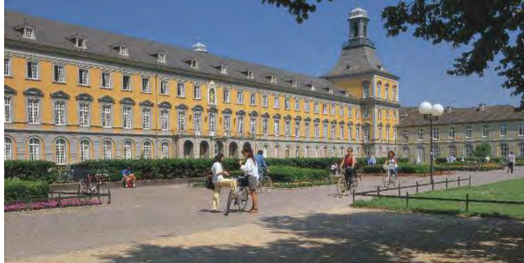
Rheinische Friedrich-Wilhelms-Universität Bonn