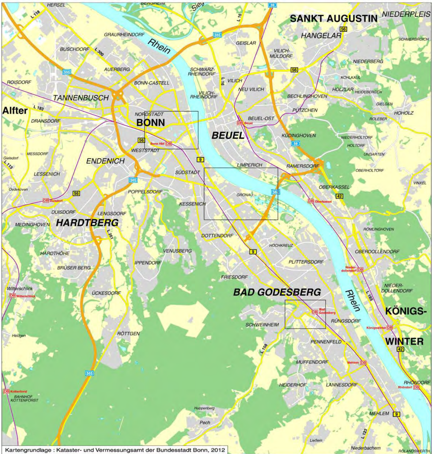
Kartengrundlage : Kataster- und Vermessungsamt der Bundesstadt Bonn, 2012