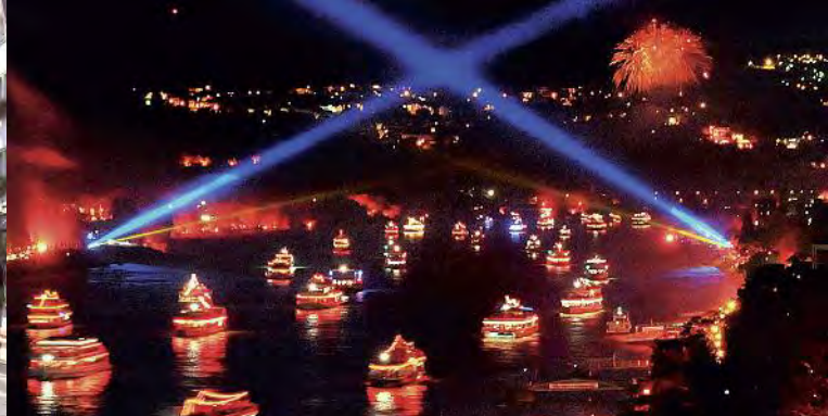
Rhein in Flammen