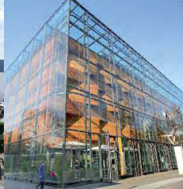
LVR - Landesmuseum Bonn