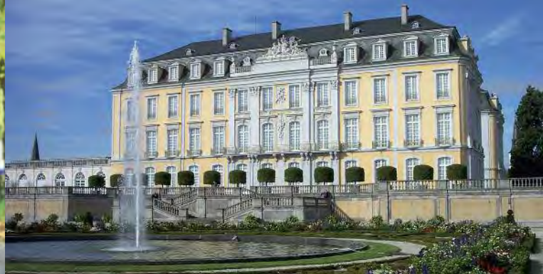
Schloss Augustusburg, UNESCO Kultur- und Naturerbe der Welt