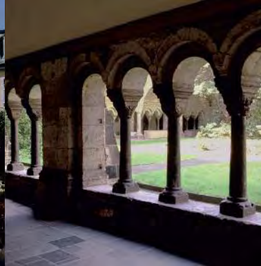
Kreuzgang der Münsterbasilika