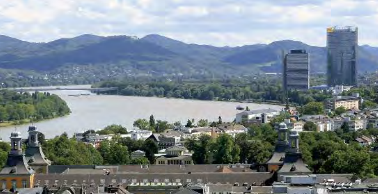
Bonn am Rhein